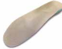
Ortopedik ayakkabı tabanlık